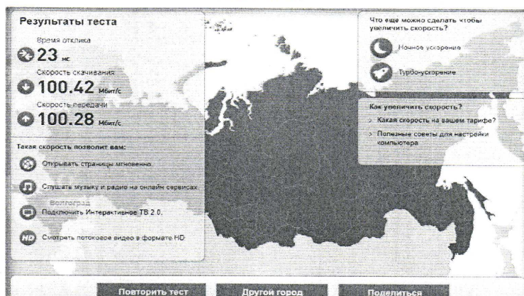
Скриншот контроля пропускной способности к п.7.1 инструментального контроля № 244

инструментального контроля параметров подключения СЗО Муниципальное общеобразовательное учреждение "Средняя школа с углубленным изучением отдельных предметов №33 Дзержинского района Волгограда" Волгоградская область, г. Волгоград, ул. имени Константина Симонова, 29