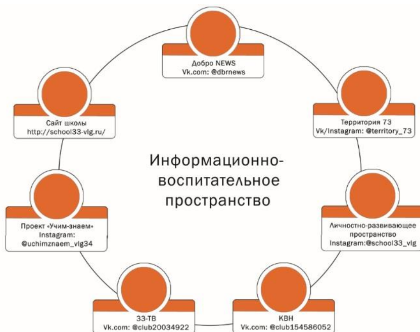
Модель «Школьные медиа»