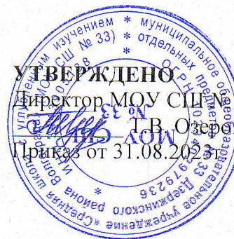
График посещения школьной столовой МОУ СШ № 33 комиссией, осуществляющей родительский контроль